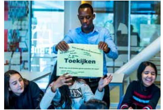
Op anonieme vragenlijsten geven sommige leerlingen van vmbo Melanchton de sfeer en veiligheid een 5, maar in de klas durven zij zich niet uit te spreken.

gen binnenkomen. Spangen is een wijk waarin het voor kan komen dat een leerling getuige is geweest van een schietpartij en dat ouders dat vergeten zijn te melden bij school. Zo'n traumatische ervaring kan natuurlijk probleemgedrag veroorzaken en de veiligheid in een klas negatief beïnvloeden. De mentorstop is bedoeld om te monitoren wat er die dag met de leerlingen in de klas is gebeurd. En of er dingen zijn waar ze tegenop zien of waar ze hulp bij nodig hebben."