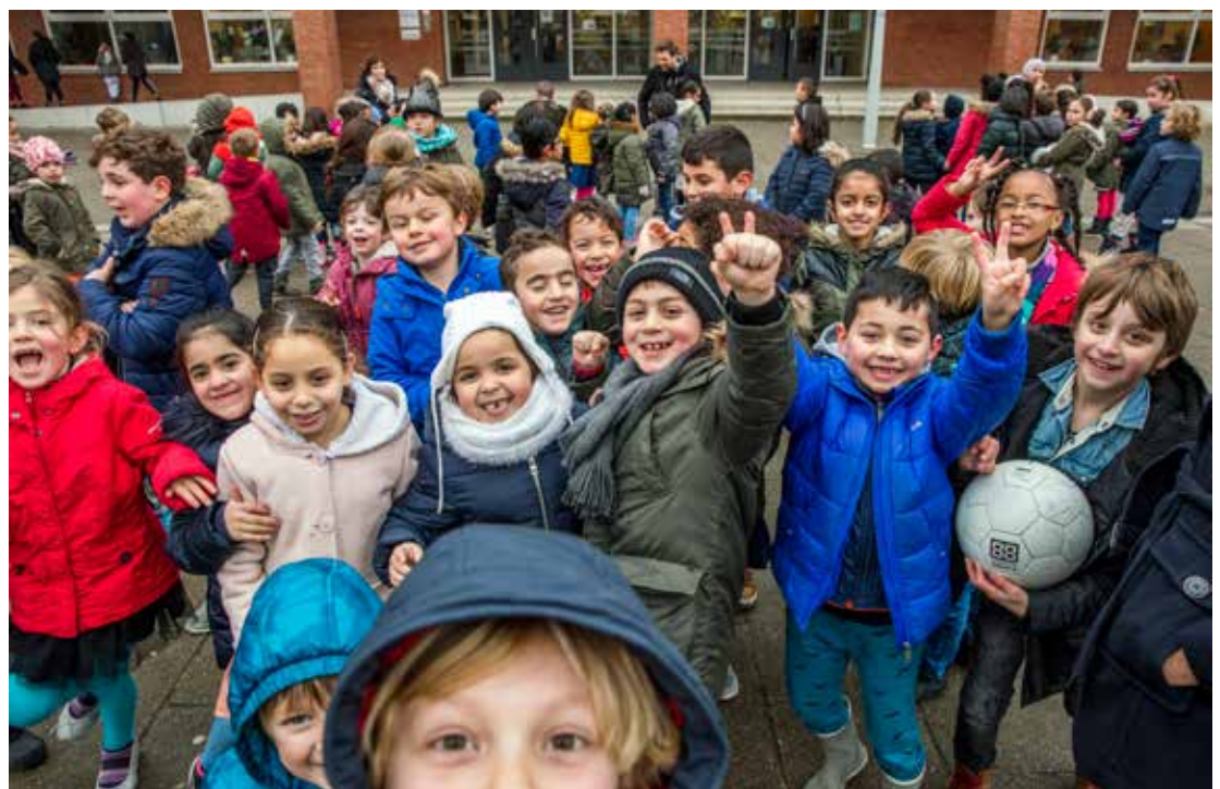
De Joop Westerweelschool in Amsterdamse wijk De Baarsjes was tien jaar geleden zwart, intussen zijn de groepen 1 tot en met 6 behoorlijk gemengd.