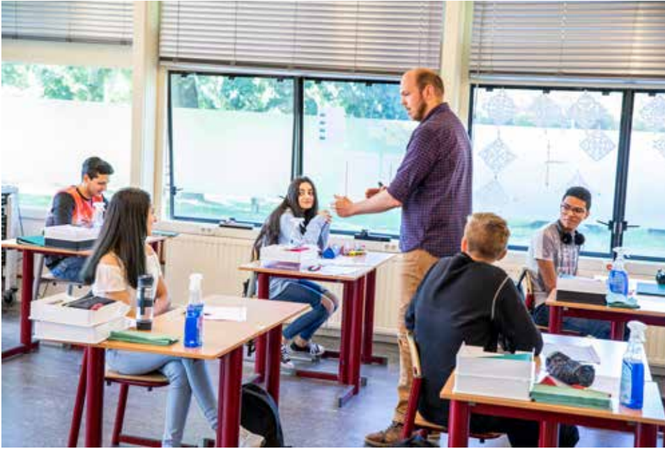
Vanwege de coronamaatregelen staan de tafels op afstand van elkaar in Den Helder bij Schakel aan Zee, een internationale schakelklas voor anderstalige leerlingen tussen 12 en 18 jaar.

asielzoekerscentra in Den Helder. “Ik spreek zowel Arabisch als Koerdisch maar misschien nog wel veel belangrijker is het feit dat ik dezelfde achtergrond heb als deze jongeren. Ik weet hoe je je voelt als je onzeker bent over je toekomst en als je in spanning zit of je wel of geen status krijgt. Het is op zo’n moment heel moeilijk om je te concentreren op zoiets als het leren van een nieuwe taal. Ik belde dan met deze leerlingen en kon ze dan geruststellen en duidelijkheid geven over de situatie.”