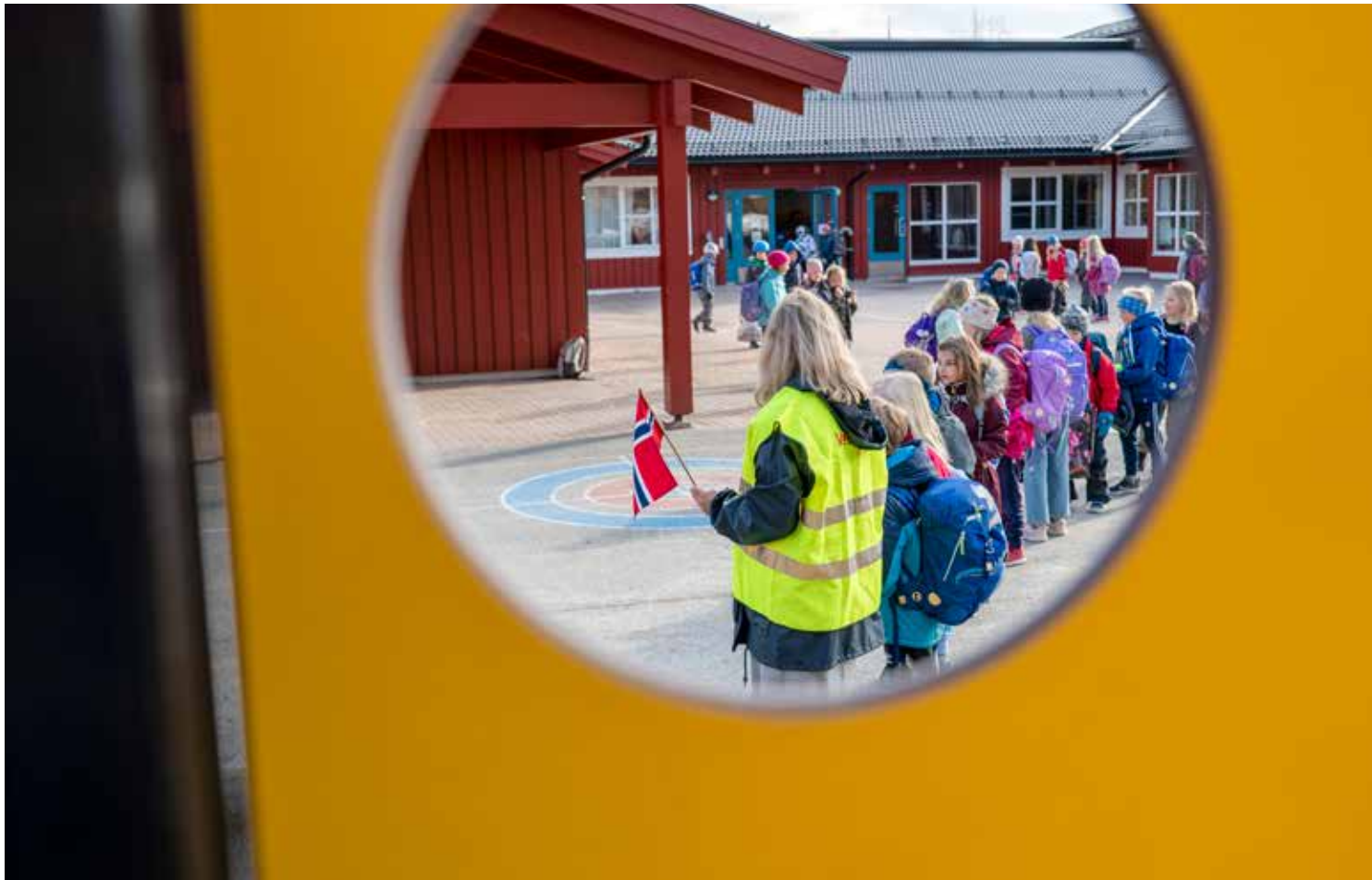
Jonge kinderen op het schoolplein van de Vikåsen Skole in Trondheim. Na een korte lockdown voor de zomer bleven de scholen in Noorwegen lang open, maar sinds 22 januari wordt er opnieuw onderwijs op afstand gegeven.

Ook Laura Bedet, sinds 2014 leerkracht op een basisschool in Langhus, een dorp op zo’n twintig kilometer van de Noorse hoofdstad Oslo, herinnert zich de lockdown van vorig jaar nog goed. “Bij ons duurde die schoolsluiting gelukkig veel minder lang dan in andere landen, van 9 maart tot eind april. En als school hadden we één groot voordeel en dat was dat we al werkten met iPad-onderwijs, waardoor de overgang naar afstandsonderwijs minder groot was. Je mist natuurlijk wel het ‘live’ contact, maar het was goed te doen.” Bedet, die toen klas 3 had, vergelijkbaar met groep 5 in Nederland, werkte in die periode veel met spelvormen en challenges die ze in Nederlandse Facebook-groepen vond en vertaalde naar het Noors. “Leerlingen moesten dan een opdracht doen en daar met hun iPad een foto van maken en die vervolgens naar mij sturen. Ik maakte van die bijdragen een digitaal boekje dat ik dan weer naar alle leerlingen stuurde. De kinderen keken daar steeds enorm naar uit, omdat ze dan ook konden zien wat andere kinderen gemaakt hadden.” Leerlingen van de Langhus Skole mochten na de paasvakantie weer fulltime naar